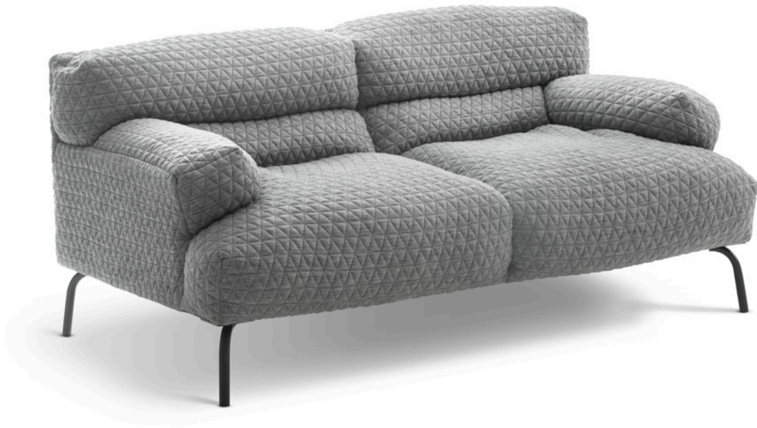
1-zits Lazy Bastard