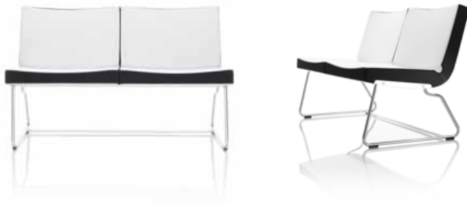
Medstativ / Sled base