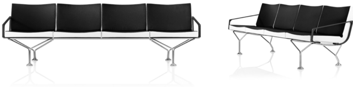
Pelarstativ / Pillar base