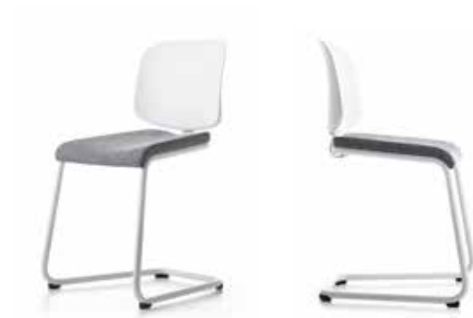
Stol / Chair