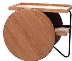
rovere naturale/ natural oak RAL 9005