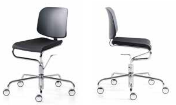
Pall 46/56 / Stool 46/56