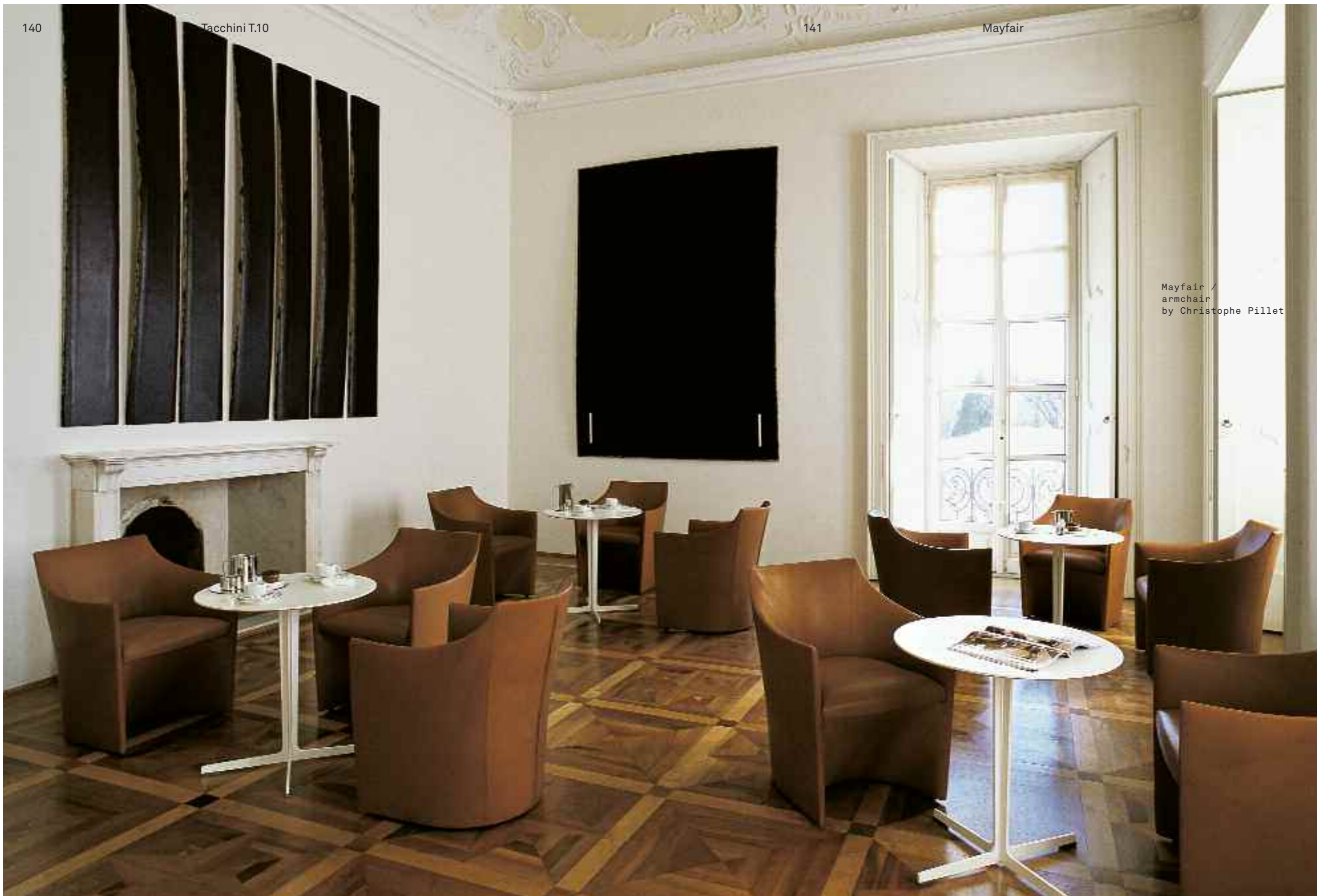
Mayfair / armchair by Christophe Pillet