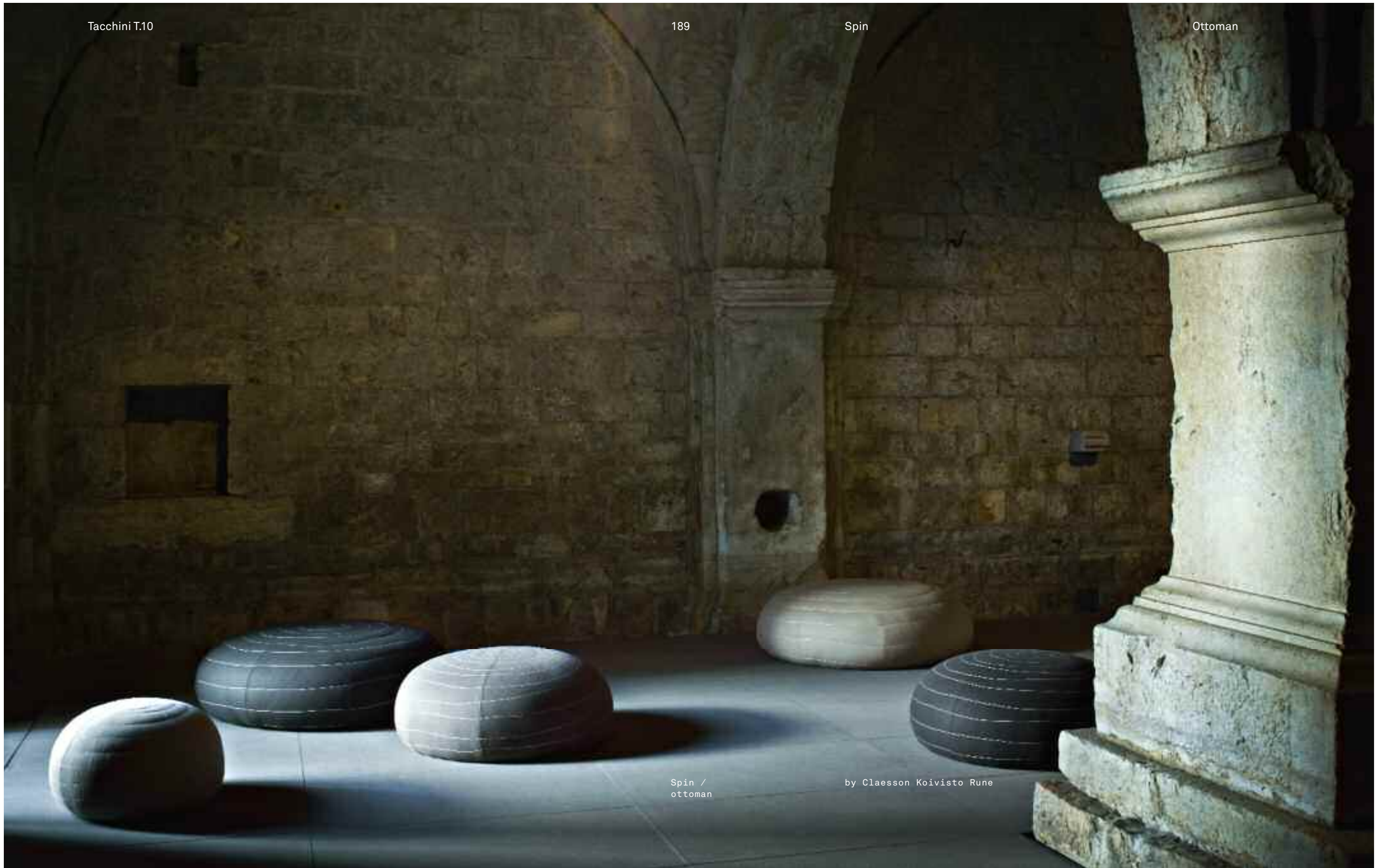
Spin / ottoman