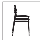
* Impilabile Stackable Empilable Stapelbar Apilable