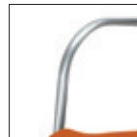
Telaio verniciato alluminio Painted aluminium frame