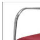
Telaio cromato Chormed frame