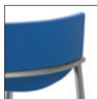
Schienale imbottito Padded backrest