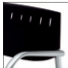
Schienale nero Black backrest

Sillas multiuso con estructura 4 patas apilable o con base patín en acero pintado aluminio o cromado, con asiento tapizado y respaldo en polipropileno negro, gris o tapizado.