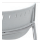
Schienale grigio Grey backrest