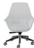
Imbottitura "romboidale" "Rhomboidal" pad