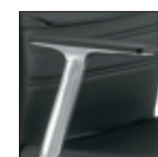
Bracciolo alluminio, con soprabracciolo imbottito o poliuretano Aluminium arm, padded or polyurethane top