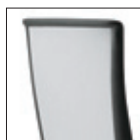
Kompasso mesh Schienale rete Mesh backrest