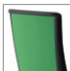
Kompasso Schienale imbottito Padded backrest