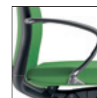
Bracciolo flessibile in poliuretano Flexible polyurethane arm