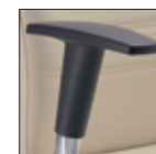
Bracciolo regolabile Adjustable arm