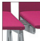
KBR5 Aggancio Linking device