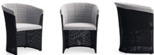
Club Easy chair by Christophe Pillet