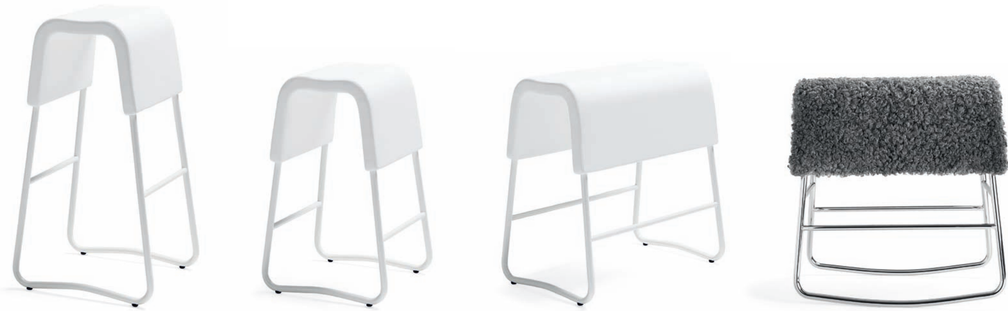
BPO90 PLINT barpall / bar stool / barhocker / tabouret de bar