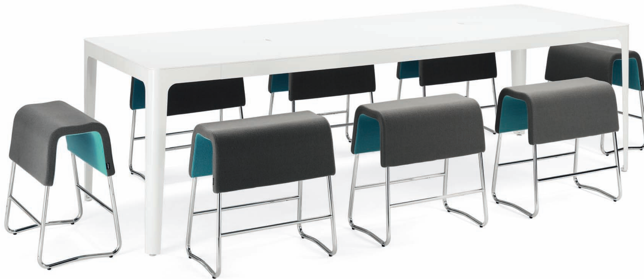
BPO90 PLINT barpall / bar stool / barhocker / tabouret de bar KB120 AVA konferensbord / conference table / konferenztisch / table de réunion