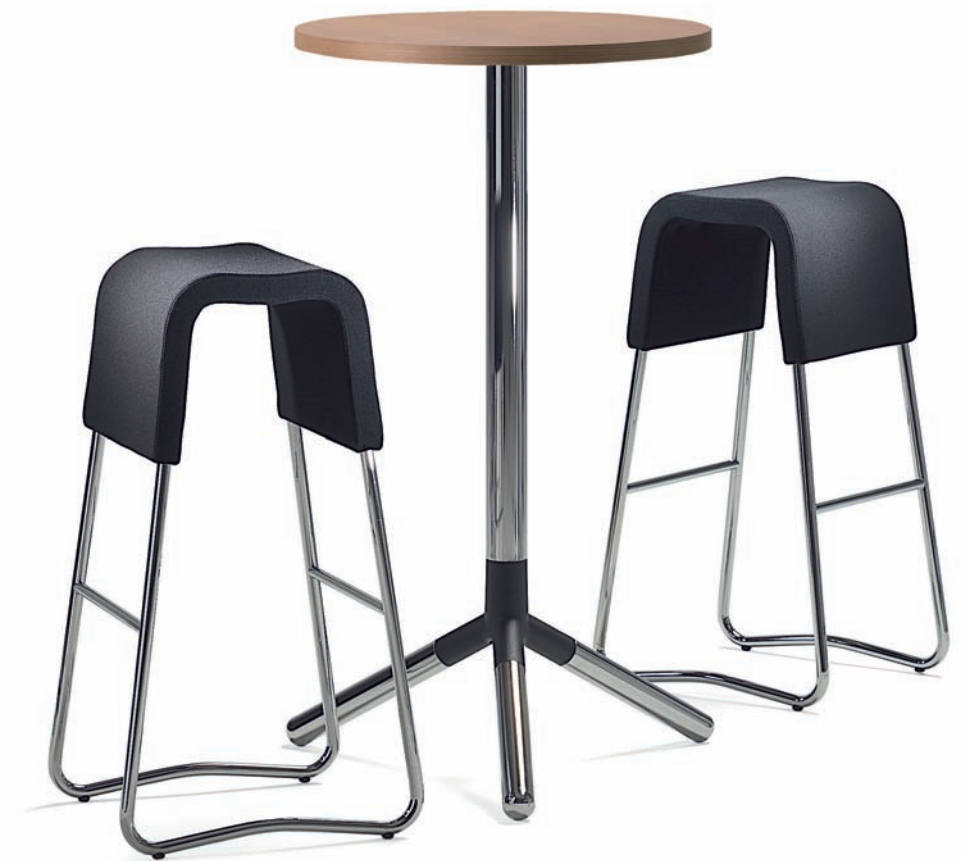
BPO90 PLINT barpall / bar stool / barhocker / tabouret de bar PB170 OBI bord / table / tisch / table