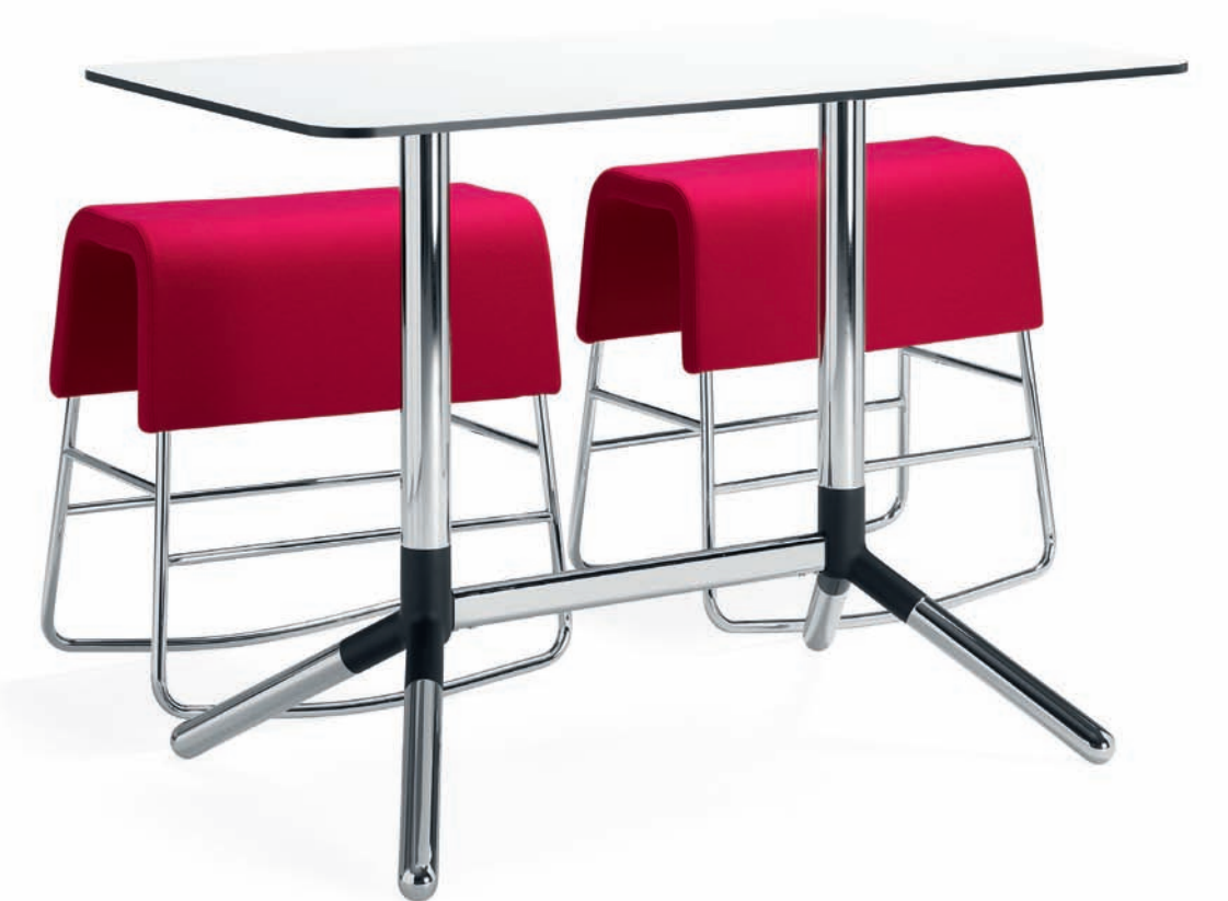
BPO90 PLINT gungpall / rocking stool / schaukelhocker / tabouret à bascule PB170 OBI bord / table / tisch / table