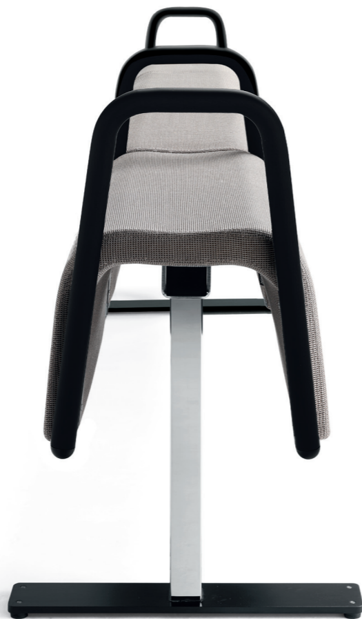
BS0940 PLINT balk / beam / bank / rail