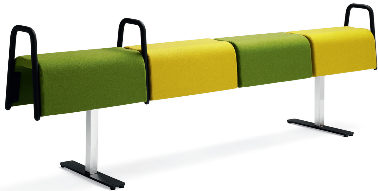
BS0940 PLINT balk / beam / bank / rail