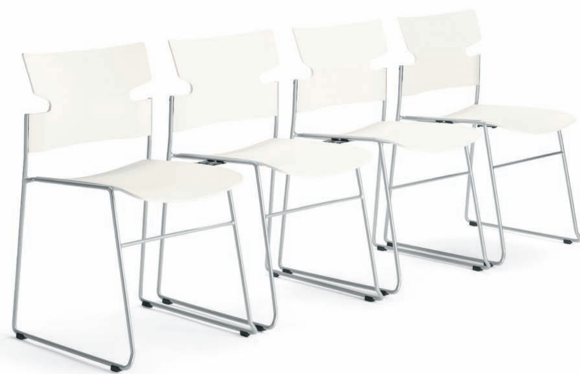
S260 STACK stol / chair / stuhl / siège TB260 STACK kopplingsbeslag / linking device / verbindungsbeschlag / raccords de couplage