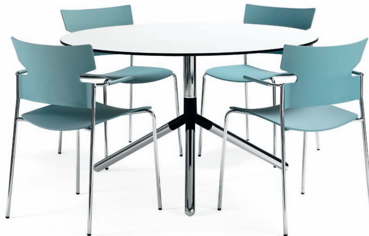
KS260 STACK karmstol / armchair / armlehnstuhl / fauteuil PB170 OBI bord / table / tisch / table