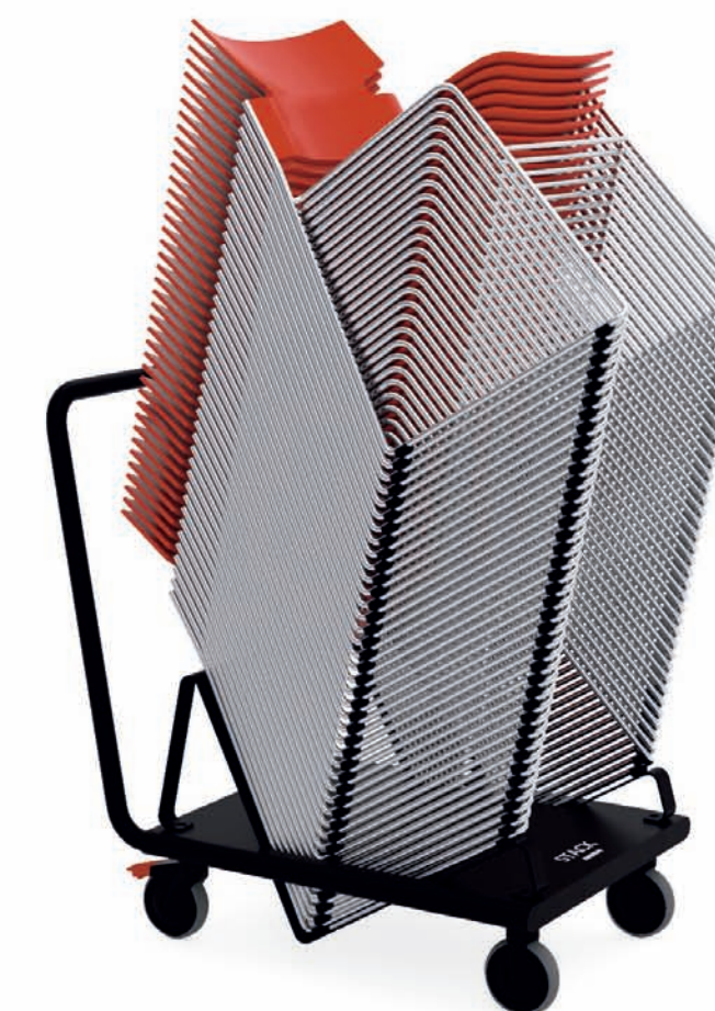
S260 STACK stol / chair / stuhl / siège TB260 STACK transportvagn / transport carriage / transportwagen / transport chariot