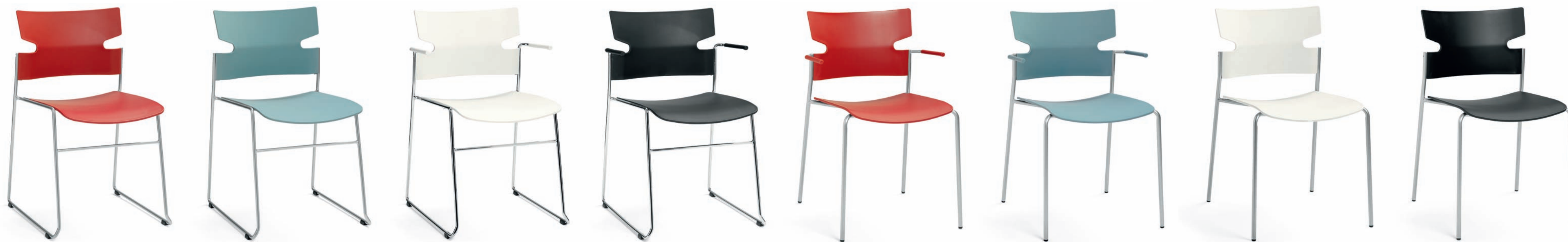
S260 STACK stol / chair / stuhl / siège