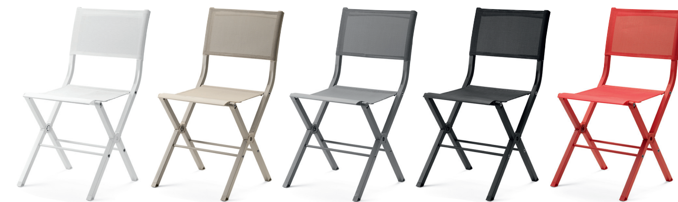
FS6400 XTRA fällstol / folding chair / klappstuhl / chaise pliante