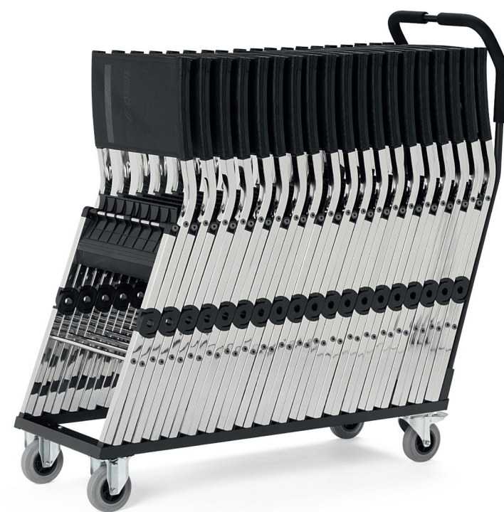
FS6400 XTRA fällstol / folding chair / klappstuhl / chaise pliante TB6400 XTRA stolsvagn / transport carriage / transportwagen / transport chariot