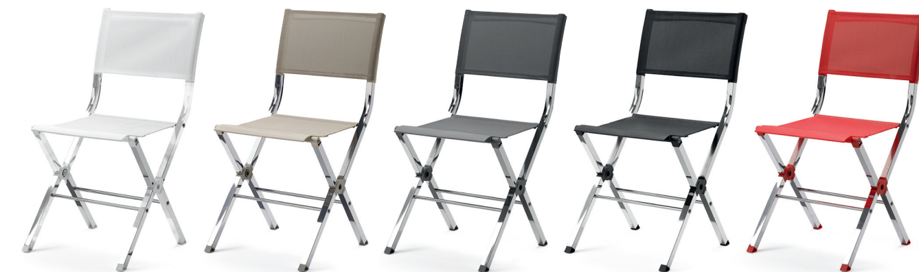
FS6400 XTRA fällstol / folding chair / klappstuhl / chaise pliante