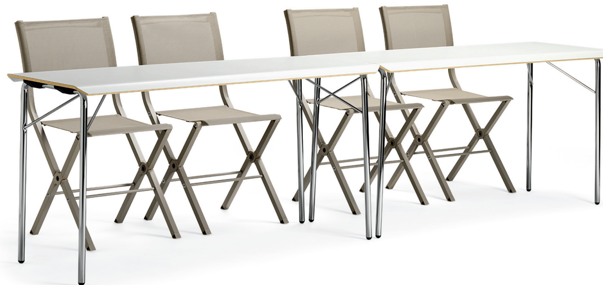
FS6400 XTRA fällstol / folding chair / klappstuhl / chaise pliante FB280 VIPER fällbord / folding table / klappstisch / table pliante