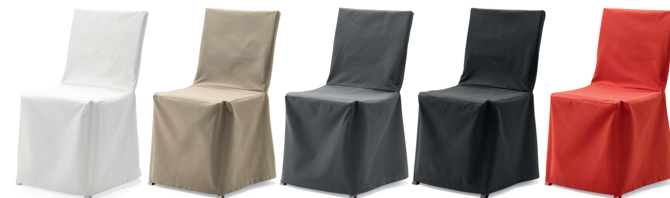
FS6400 XTRA fällstol / folding chair / klappstuhl / chaise pliante TB6400 XTRA stolsöverdrag / chair cover / überzug / housse de chaise