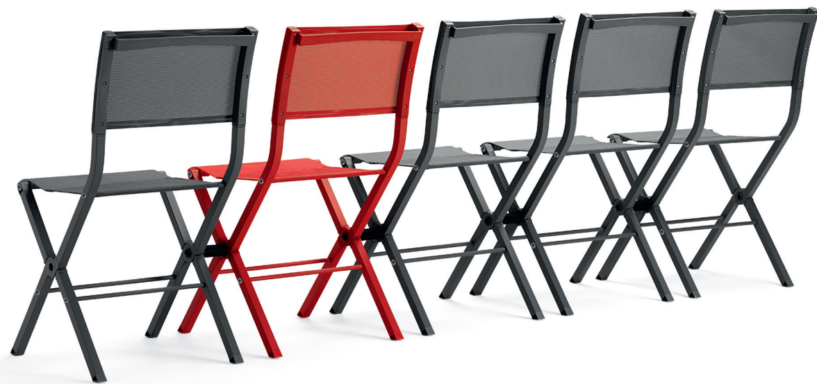
FS6400 XTRA fällstol / folding chair / klappstuhl / chaise pliante