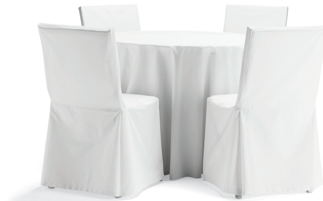
FS6400 XTRA fällstol / folding chair / klappstuhl / chaise pliante TB6400 XTRA stolsöverdrag / chair cover / überzug / housse de chaise