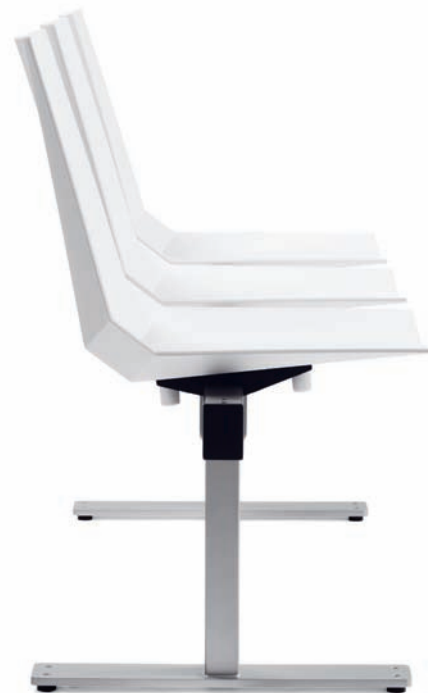
BS8860 MAYFLOWER balksoffa / beam seater / traverse / sièges sur poutre