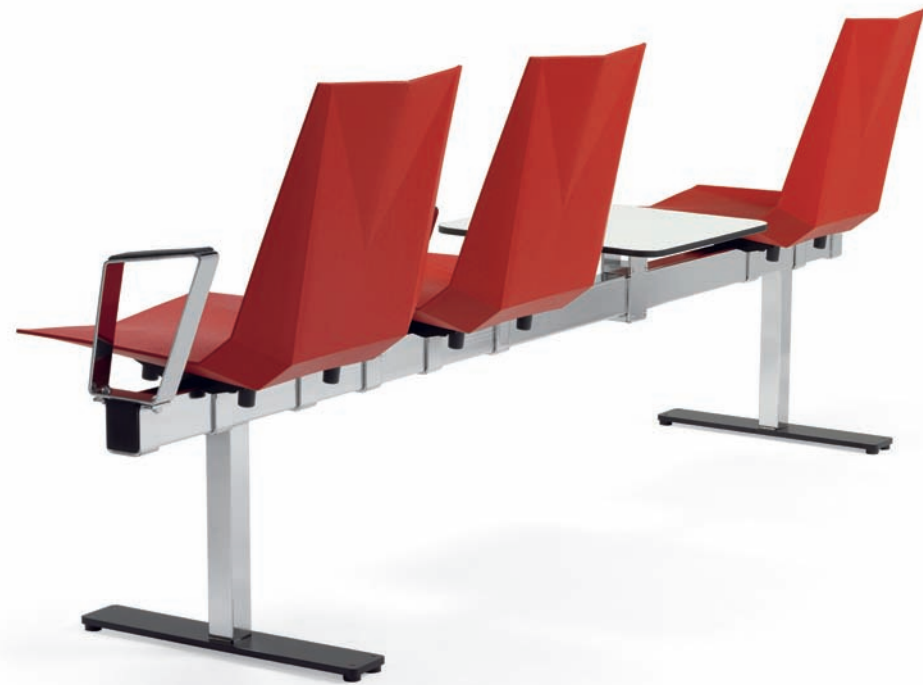
BS8860 MAYFLOWER balksoffa / beam seater / traverse / sièges sur poutre