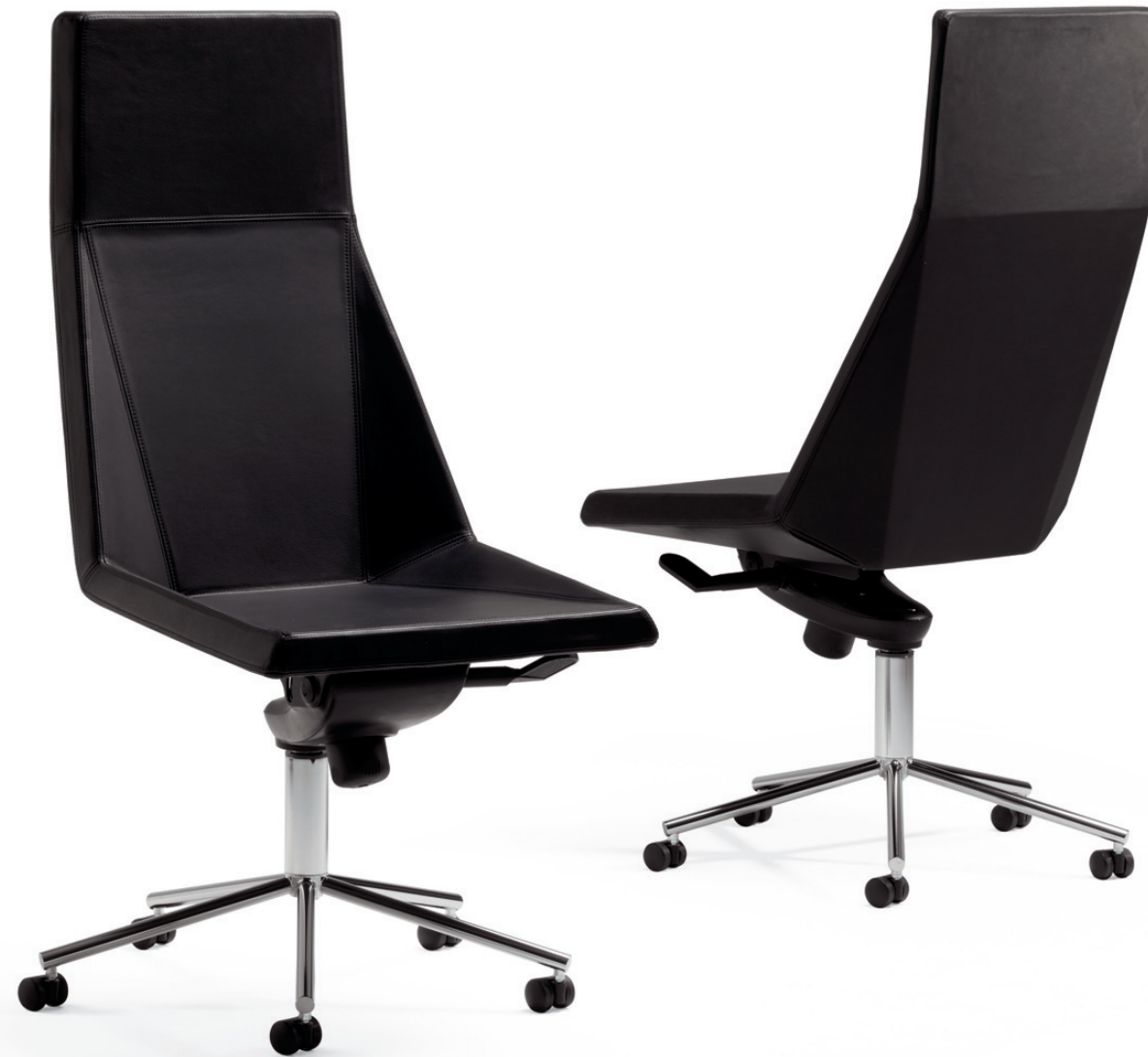
775 MAYFLOWER konferensstol / conference chair / konferenzstuhl / siège de réunion