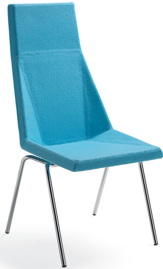
775 MAYFLOWER konferensstol / conference chair / konferenzstuhl / siège de réunion