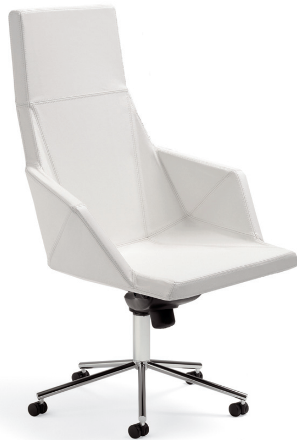
776+777 MAYFLOWER konferensstol / conference chair / konferenzstuhl / siège de réunion