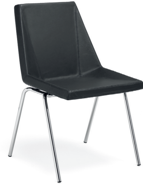
773 MAYFLOWER konferensstol / conference chair / konferenzstuhl / siège de réunion