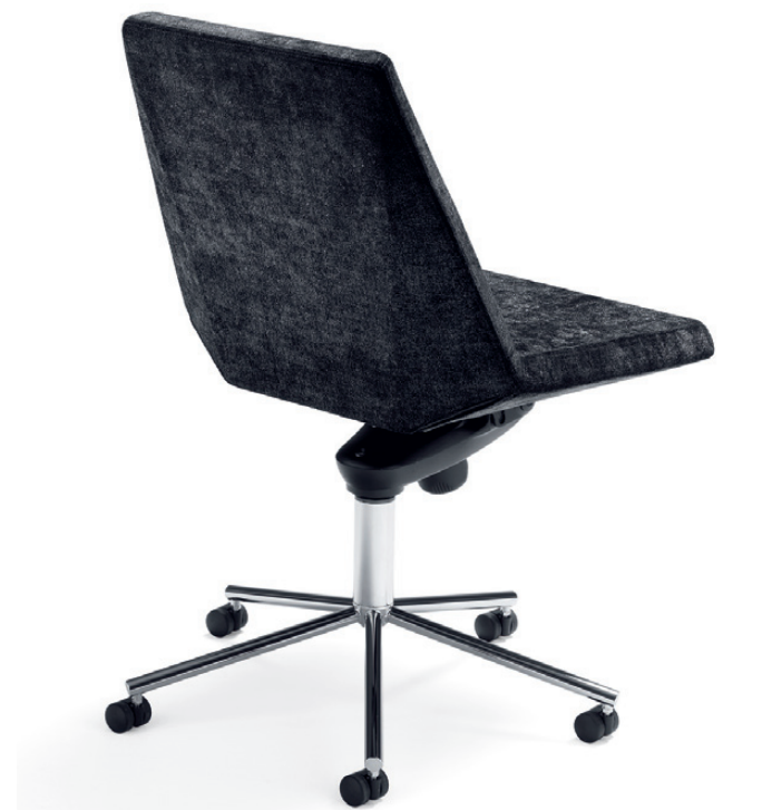
774+773 MAYFLOWER konferensstol / conference chair / konferenzstuhl / siège de réunion