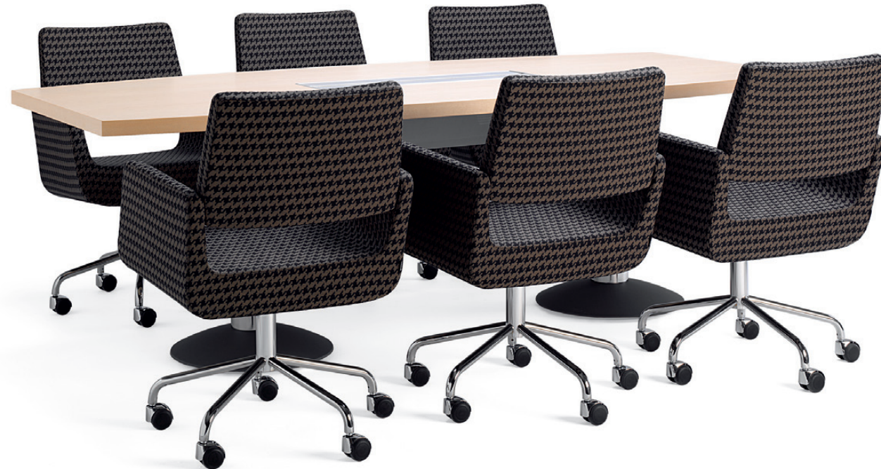
4921 GIRO konferensstol / conference chair / konferenzstuhl / siège de réunion 735-KA AGENDA konferensbord / conference table / konferenztisch / table de réunion