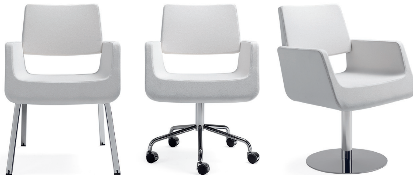
4920+4921+4922 GIRO konferensstol / conference chair / konferenzstuhl / siège de réunion