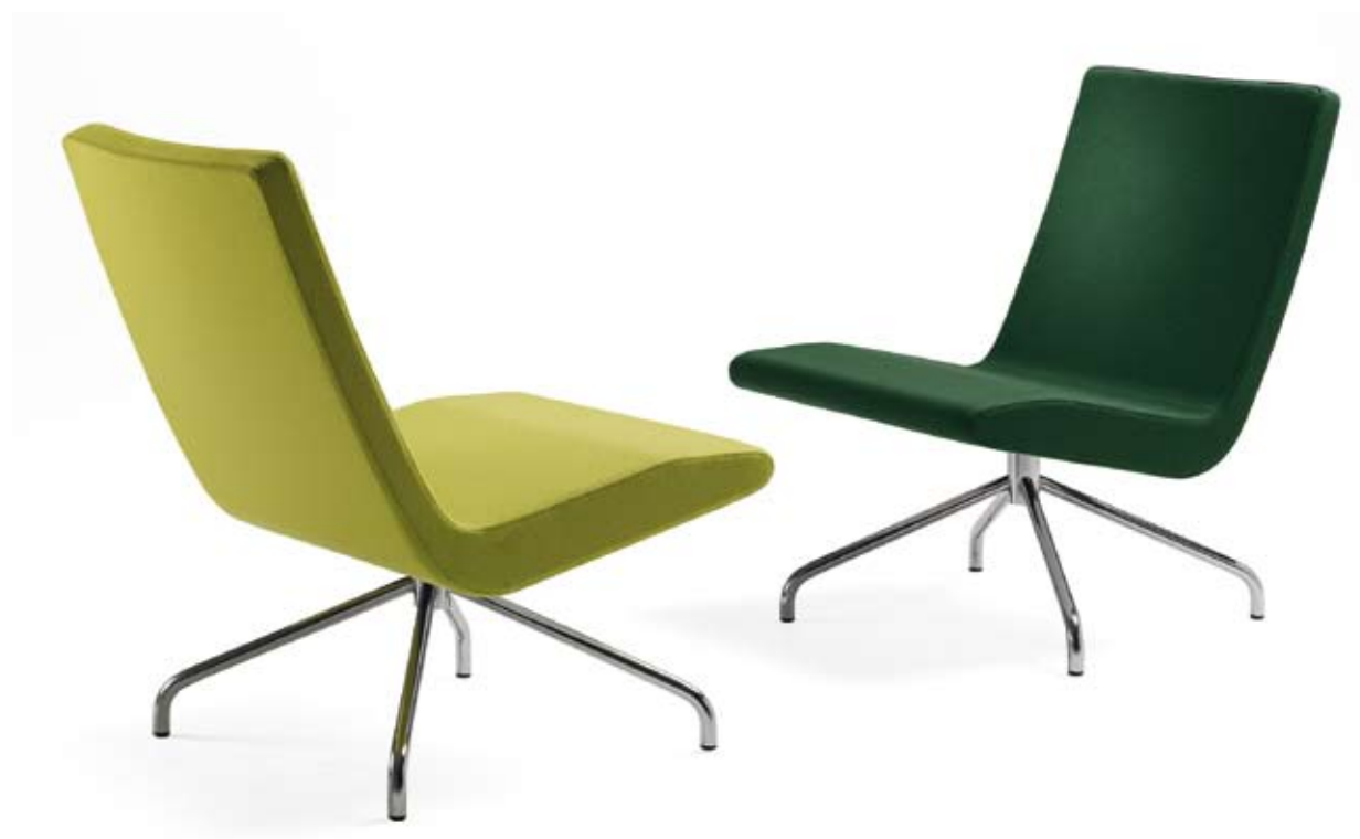
5111 ROSCOE fätölj / easy chair / sessel / fauteuil

Le Roscoe est un fauteuil confortable et ergonomique avec un support souple. Son originalité peut se fondre à différents environnements et configurations. Le piètement luge en feuille d'acier est chromé ou laqué époxy gris argenté. Un piètement à quatre pieds pivotant sur 360° est également disponible.