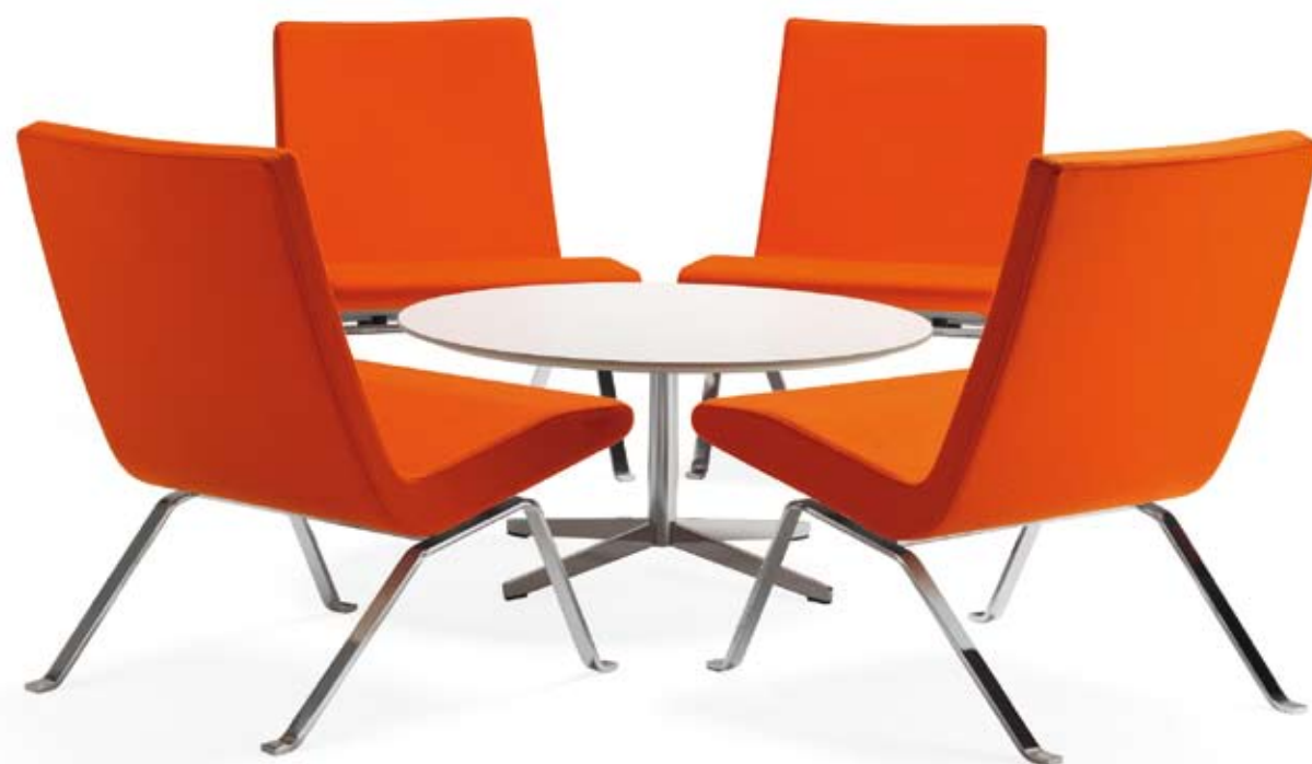
5110 ROSCOE fätölj / easy chair / sessel / fauteuil 5090 BONE bord / table / tisch / table