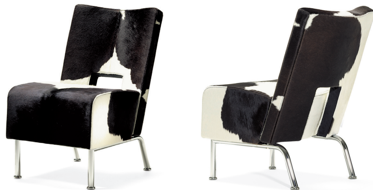
5410 ELEMENT fätölj / easy chair / sessel / fauteuil