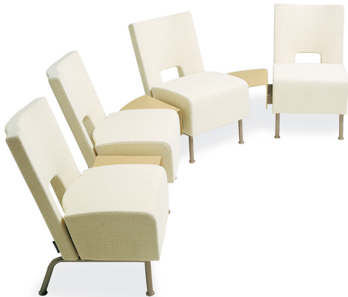
5410 ELEMENT sittsektion / seat section / sitzelement / siège modulable 5450+5445 ELEMENT kopplingsbord / linking table / kopplungstisch / table de raccordement