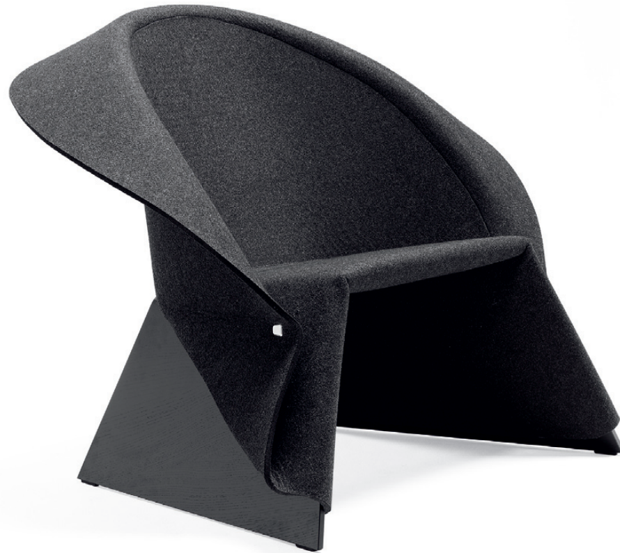
4610 COAT fätölj / easy chair / sessel / fauteuil