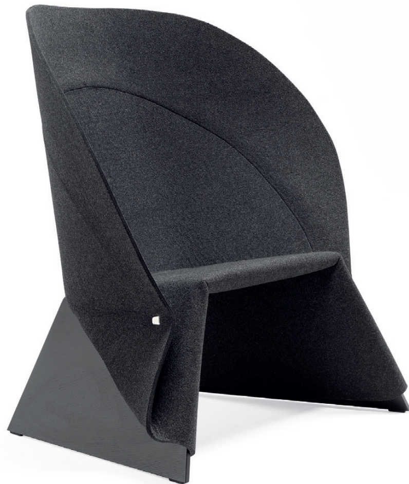
4610 COAT fätölj / easy chair / sessel / fauteuil