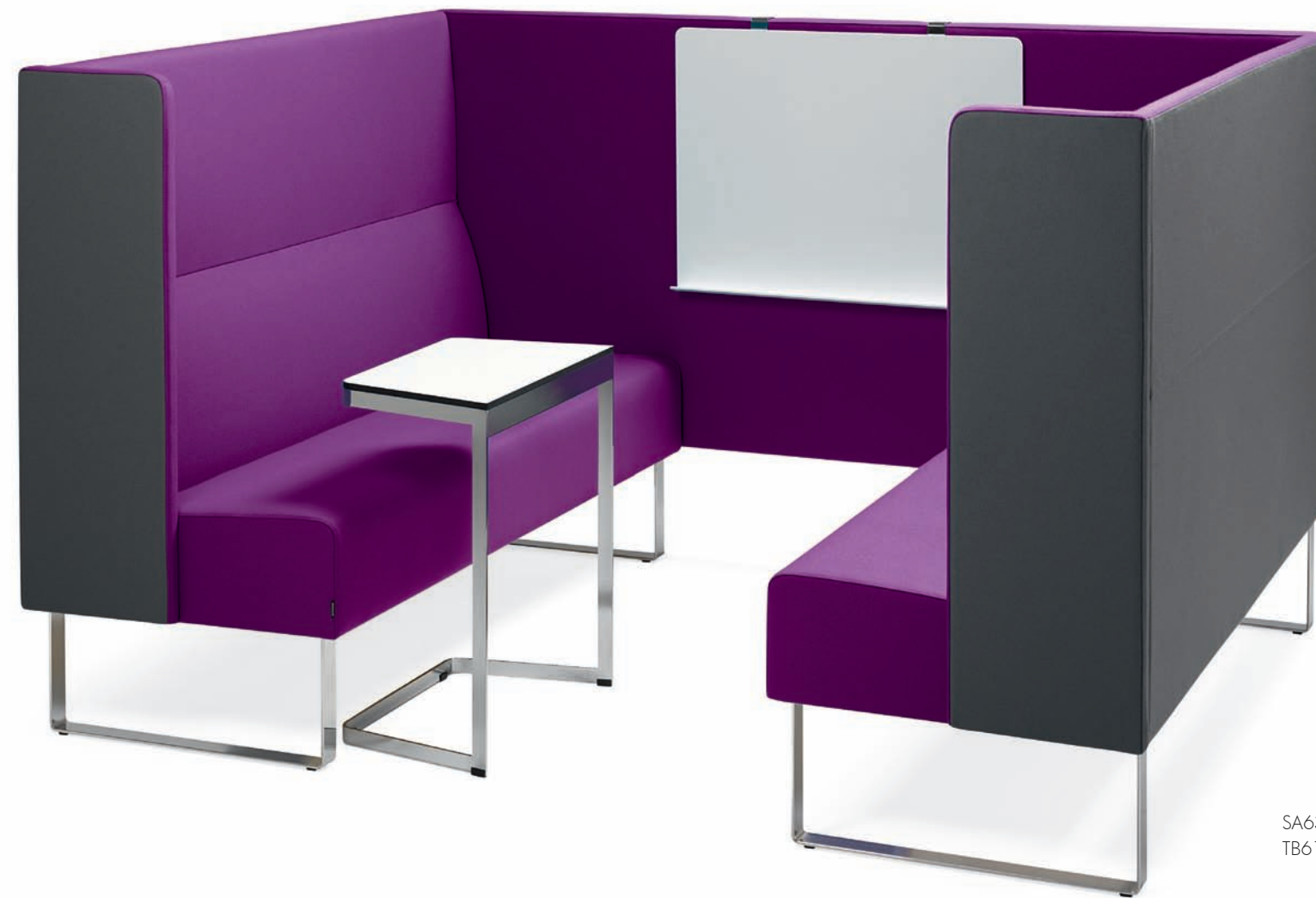
SA630 x2 + SA6399 x2 + SA650 MONOLITE sofa / sofa / sofa / canapé SB610 MONOLITE bord / table / tisch / table TB610 MONOLITE whiteboard / whiteboard / whiteboard / tableau blanc