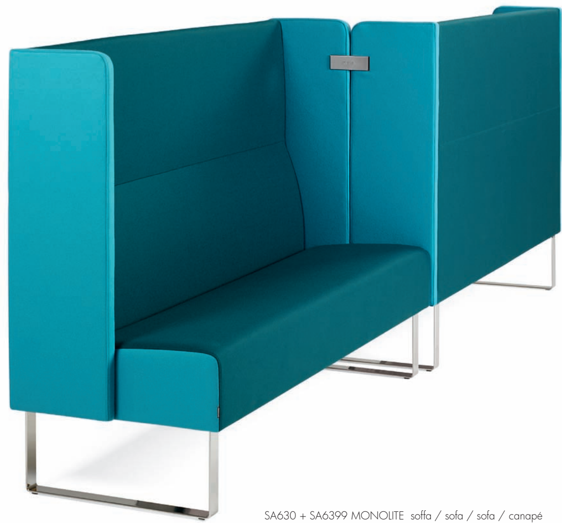
SA630 + SA6399 MONOLITE sofa / sofa / sofa / canapé