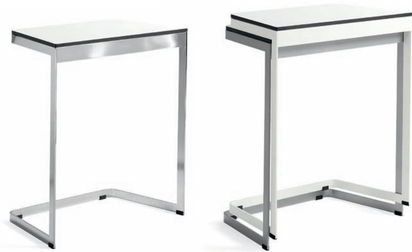
SB610 MONOLITE bord / table / tisch / table