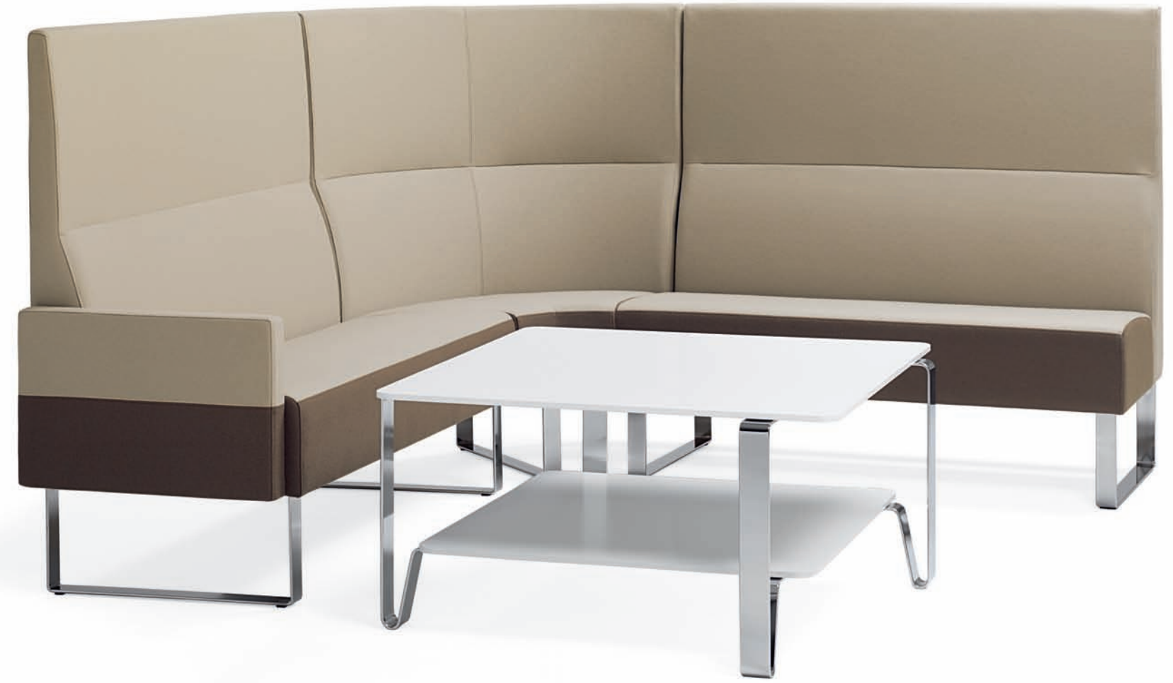
SA620 x2 + SA640 MONOLITE hörnsöffa / corner sofa / ecksofa / canapé d'angle SB200 COSMO soffbord / coffee table / couchtisch / table basse