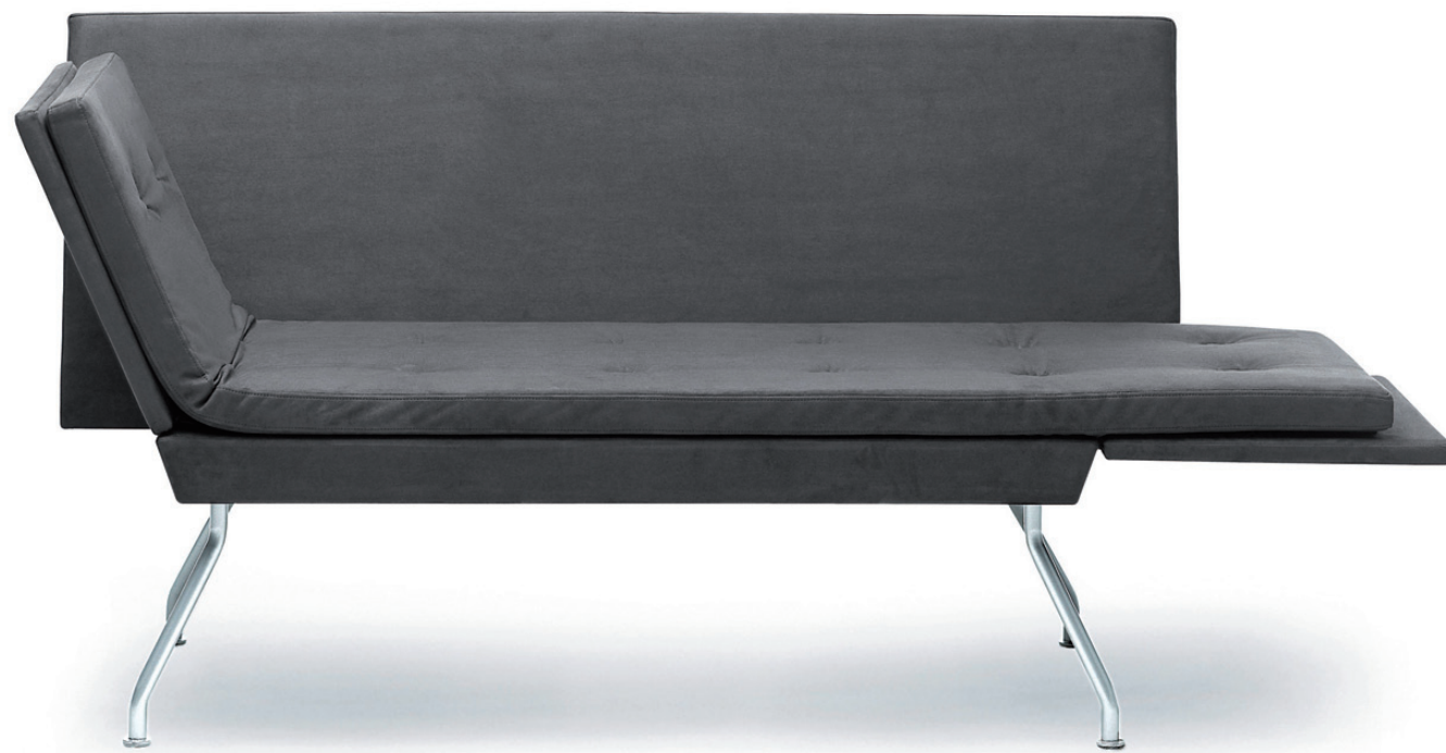
220 AVEC sofa / sofa / sofa / canapé