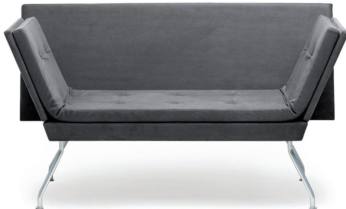
220 AVEC sofa / sofa / sofa / canapé