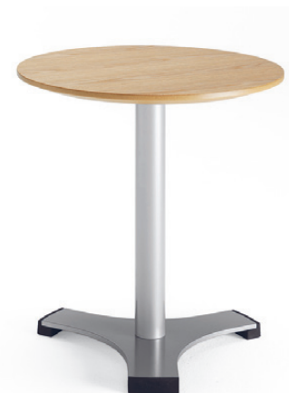
1845 TRIAD bord / table / tisch / table