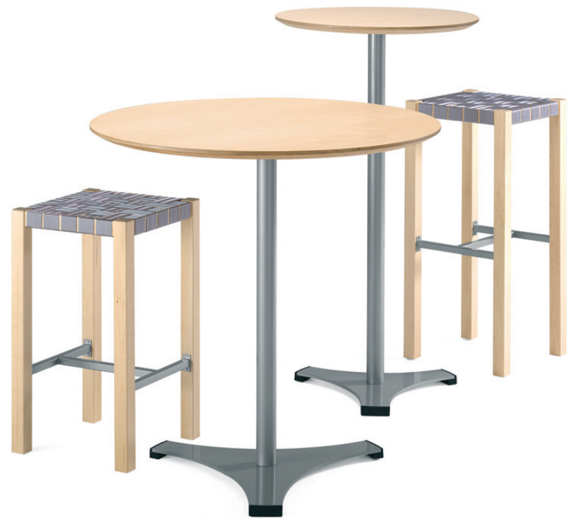
1890+1860 TRIAD bord / table / tisch / table 0505+0507 TRIAD barpall / bar stool / barhocker / tabouret de bar