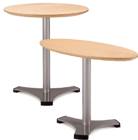
1860+1835 TRIAD bord / table / tisch / table