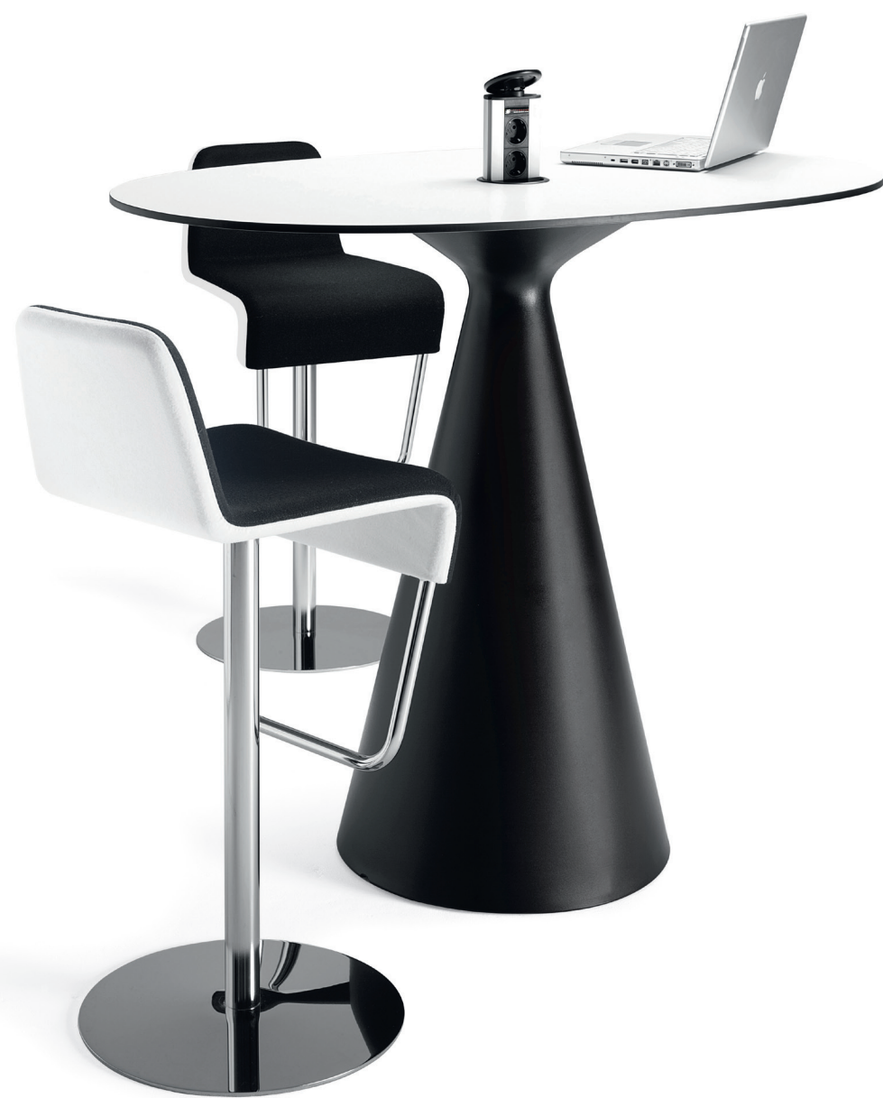
PB220 CONE bord / table / tisch / table BPO70 TURNER barpall / barstool / barhocker / tabouret de bar