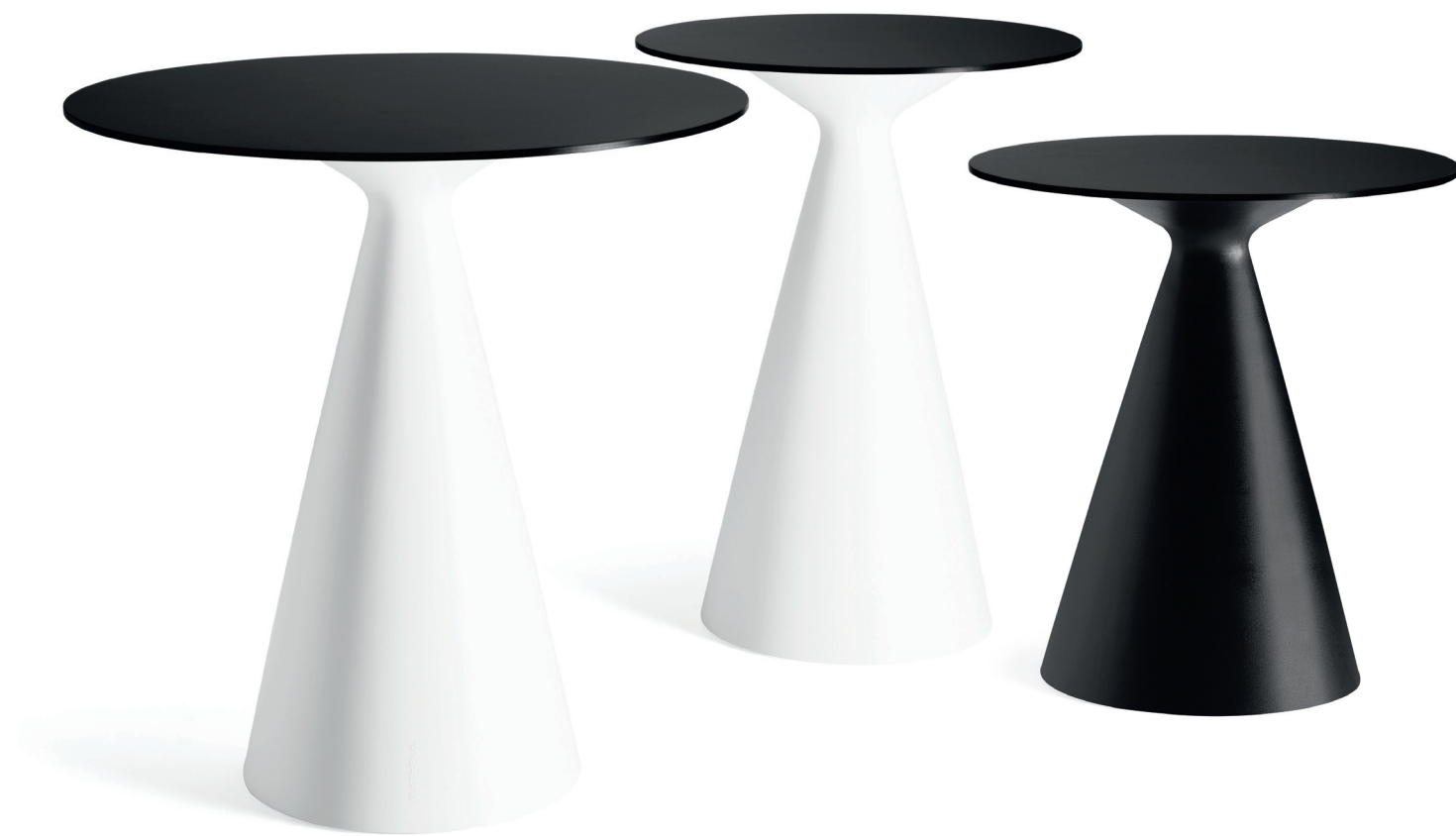
PB220 CONE bord / table / tisch / table