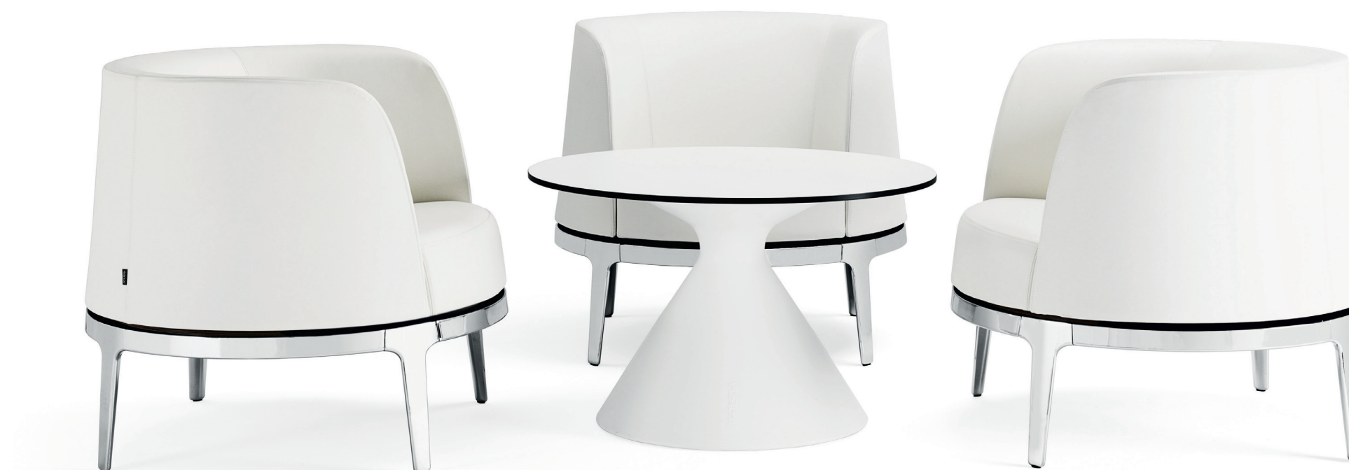
PB220 CONE bord / table / tisch / table F480 OMNI fátölj / easy chair / sessel / fauteuil