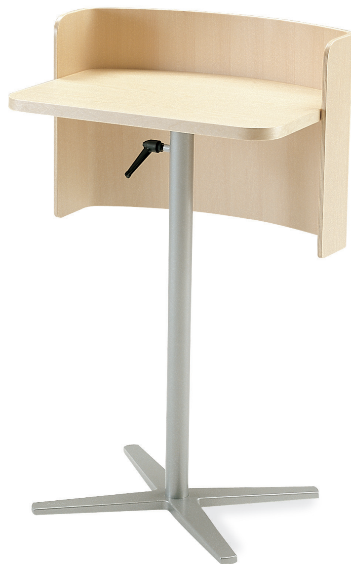
1620-1625 CENTRUM talarstol / podium / rednerpult / podium