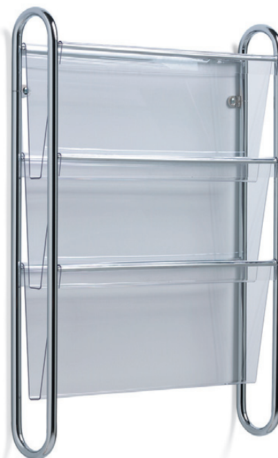
8190 FLAX tidskriftsställ / magazine holder / zeitschriftenhalter / porte-magazines