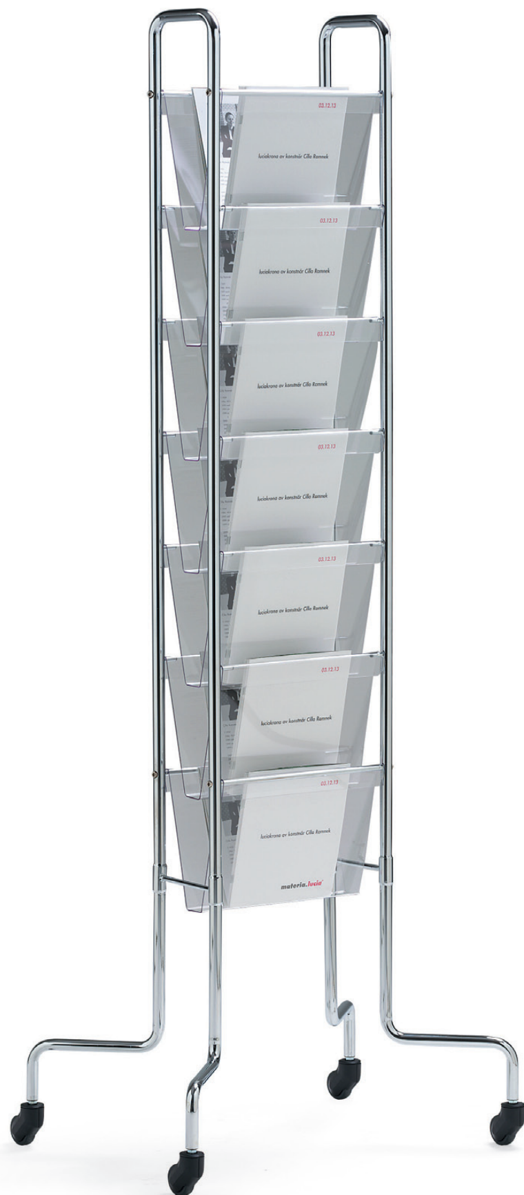
8185 FLAX tidskriftsställ / magazine holder / zeitschriftenständer / porte-magazines