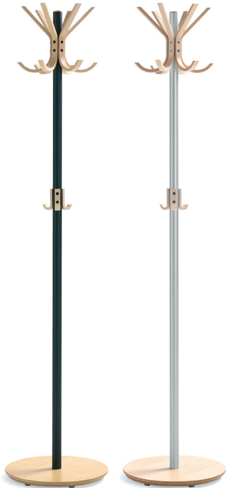
8005 KROKUS klädhängare / coat stand / garderobenständer