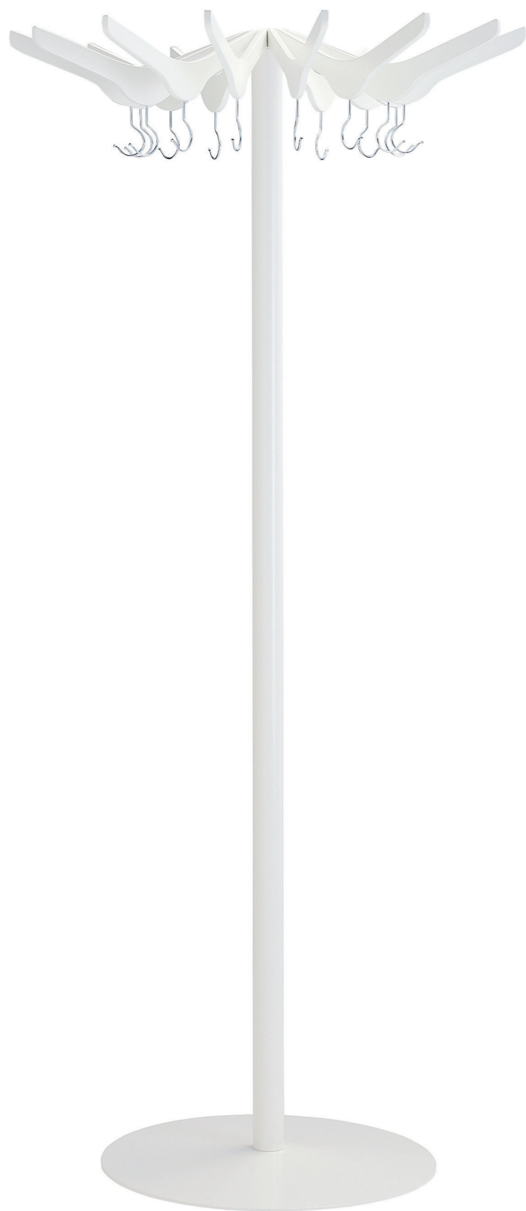
KL96050 HANGER klädhängare / coat stand / garderobenständer / portemanteau