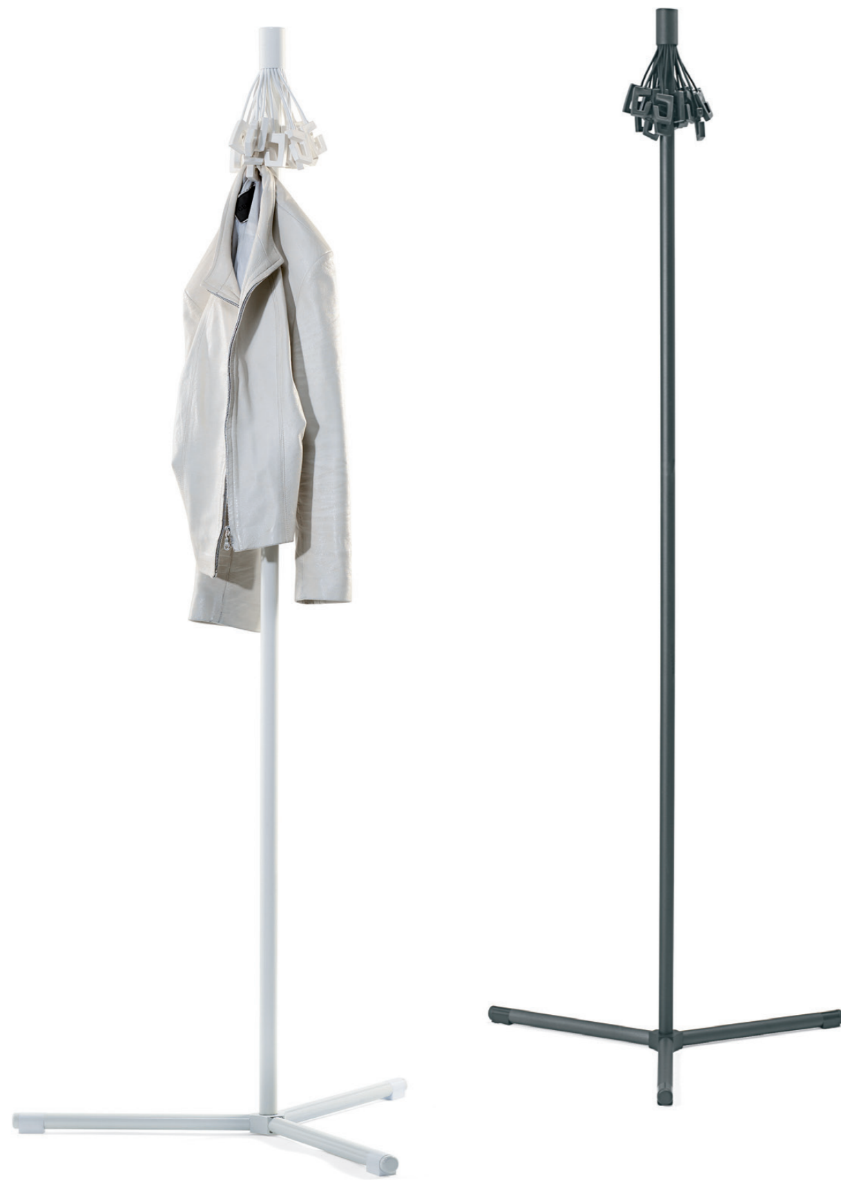
9705 GOBBLE klädhängare / coat stand / garderobenständer / portemanteau