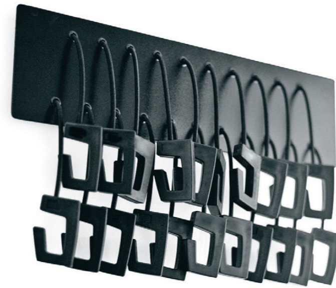
9715 GOBBLE klädhängare / coat hanger / garderobenhaken / portemanteau