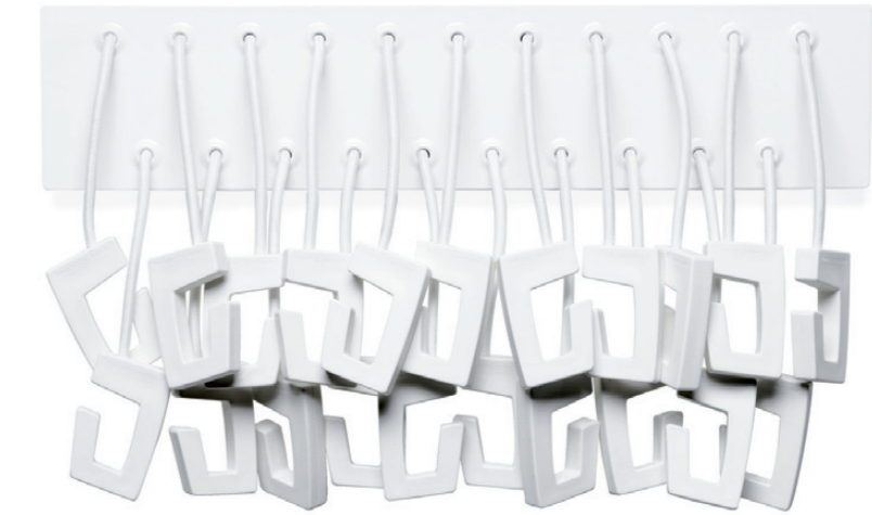
9715 GOBBLE klädhängare / coat hanger / garderobenhaken / portemanteau