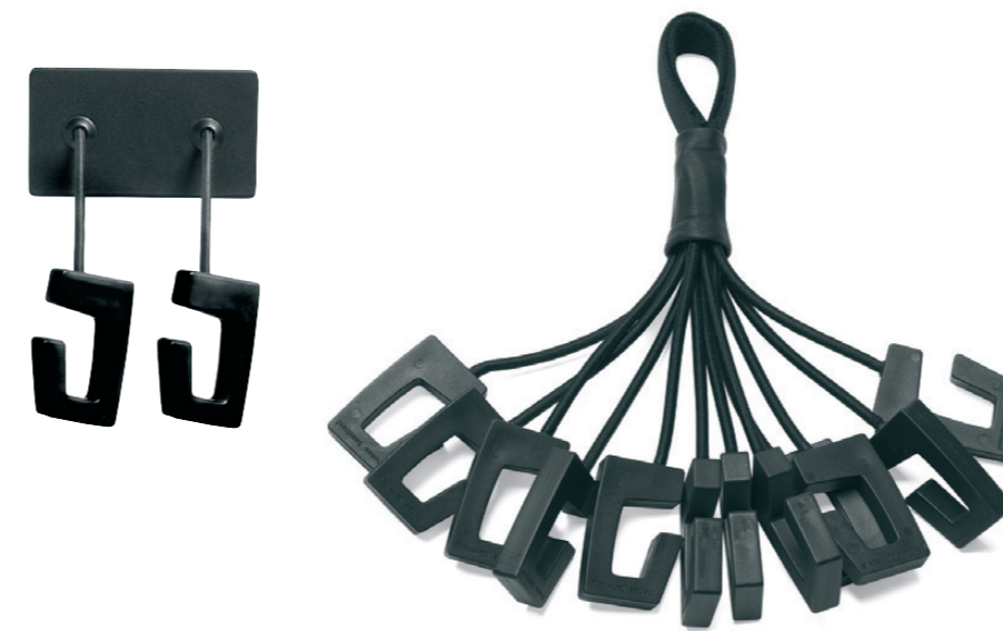
9710+9720 GOBBLE klädhängare / coat hanger / garderobenhaken / portemanteau