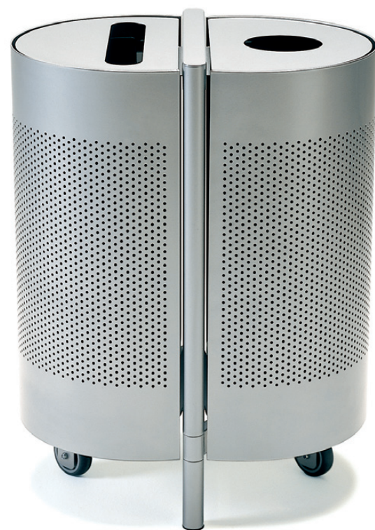
8420 DUO sorteringskärl / recycling bin / mülltrenstation / conteneur de recyclage