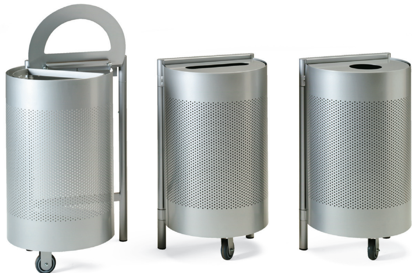
8410 UNO sorteringskärl / recycling bin / mülltrenstation / conteneur de recyclage