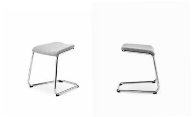
Barpall 63 / Barstool 63